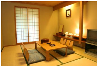
和室10畳 (バス・トイレ付)