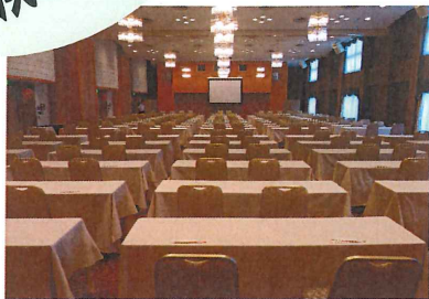
大会議室(桂・橘・桐) (約337㎡)