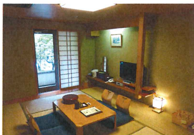
客室 和室10畳 (バス・トイレ付)